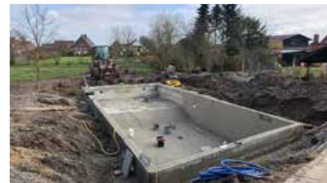
Der Umbau von einem Schwimmteich zu einem Living Pool ist ein weiteres spannendes Projekt. Die Mauern und die Bodenplatte waren Bestandteile des alten Schwimmteichs, den wir nun zum Living Pool modifiziert haben.