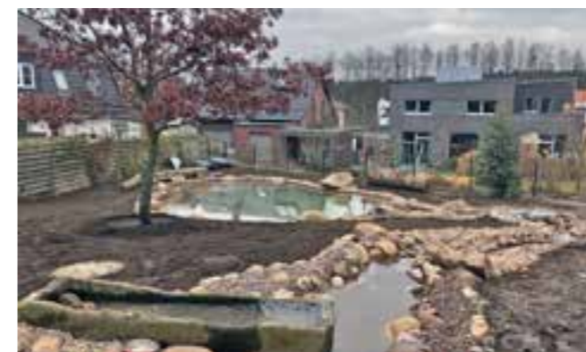
Das Projekt steht im starken Kontrast zu den geradlinigen Living Pools. Hier wurde ein Bachlauf mit alten Elementen, wie Sandsteintrögen, gebaut. Der Bachlauf endet in einem Teich. Als nächster Schritt stehen auch hier die Rasen- und Pflanzarbeiten an.