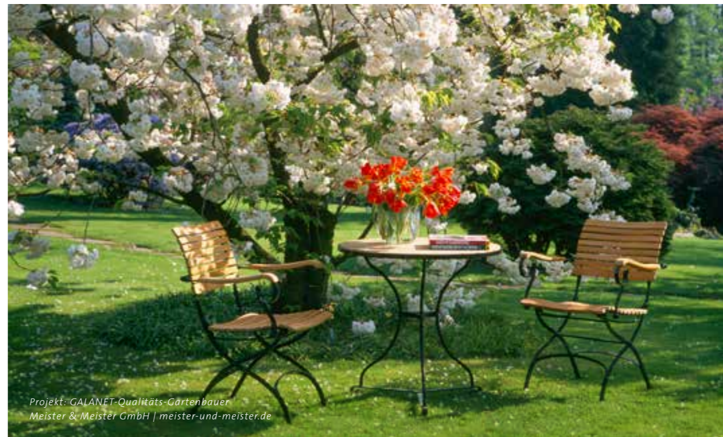
Projekt: GALANET-Qualitäts-Gartenbauer Meister & Meister GmbH | meister-und-meister.de