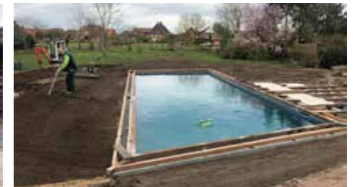
Der Rasen ist angesät und muss nun wachsen. Die Unterkonstruktion für das Holzdeck ist bereits fertiggestellt. Die Beplankung erfolgt im nächsten Schritt.