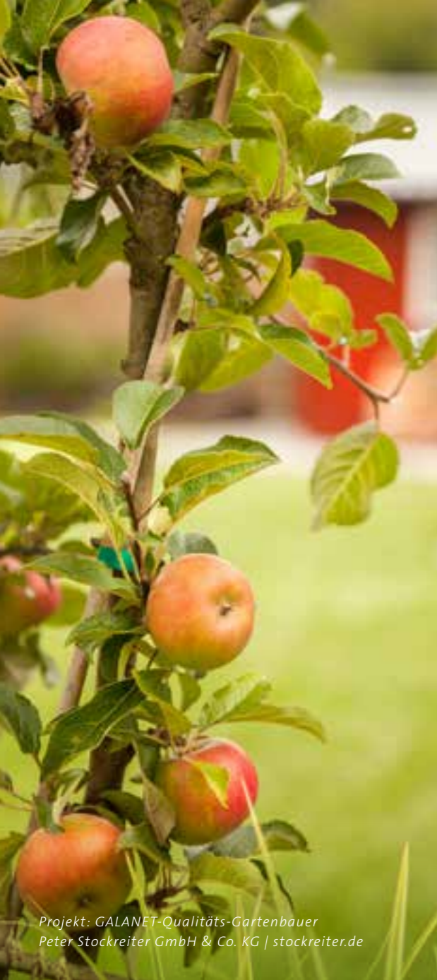
Projekt: GALANET-Qualitäts-Gartenbauer Peter Stockreiter GmbH & Co. KG | stockreiter.de