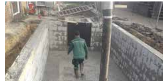
Auch in einen kleinen Garten passt ein Living Pool. Wir haben in diesen Living Pool eine Gegenstromanlage integriert. Somit können auch auf wenig Platz lange Strecken geschwommen werden.

In dieser INGRÜN-Ausgabe möchten wir Sie mit einigen Impressionen unserer Frühjahrsprojekte inspirieren.