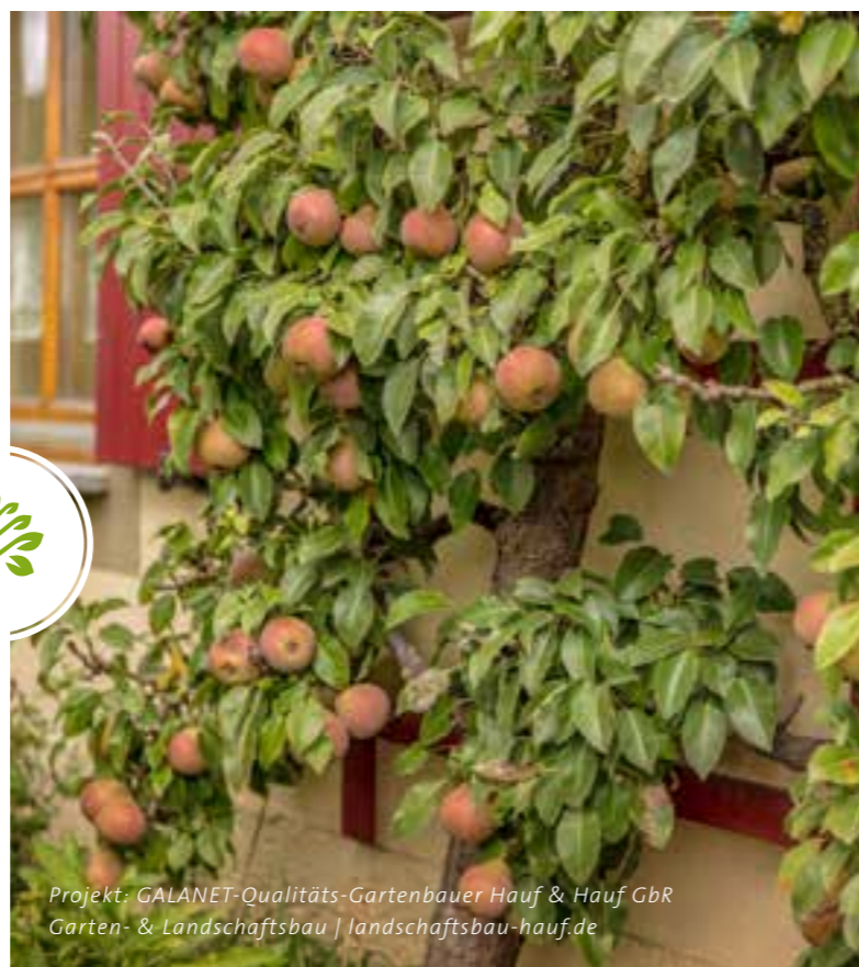
Projekt: GALANET-Qualitäts-Gartenbauer Hauf & Hauf GbR Garten- & Landschaftsbau | landschaftsbau-hauf.de